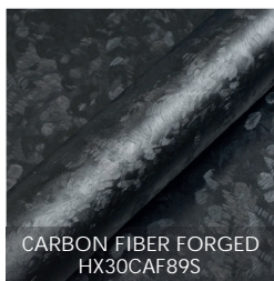
CARBON FIBER FORGED HX30CAF89S