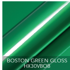
BOSTON GREEN GLOSS HX30VBOB