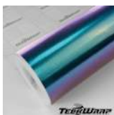
CK892G - Gloss Purple Blue